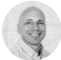
Redaktion: Poul Breil-Hansen Redaktør

Tel.: +45 2713 0010 nl@horisontgruppen.dk