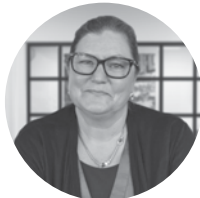
Grafisk produktion: Majbritt Refsgaard Grafiker

Telefon: +45 2371 7390 pbh@horisontgruppen.dk