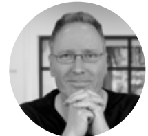
Partnerskaber: Per Christensen Digital

Telefon: +45 5350 6060 support@horisontgruppen.dk